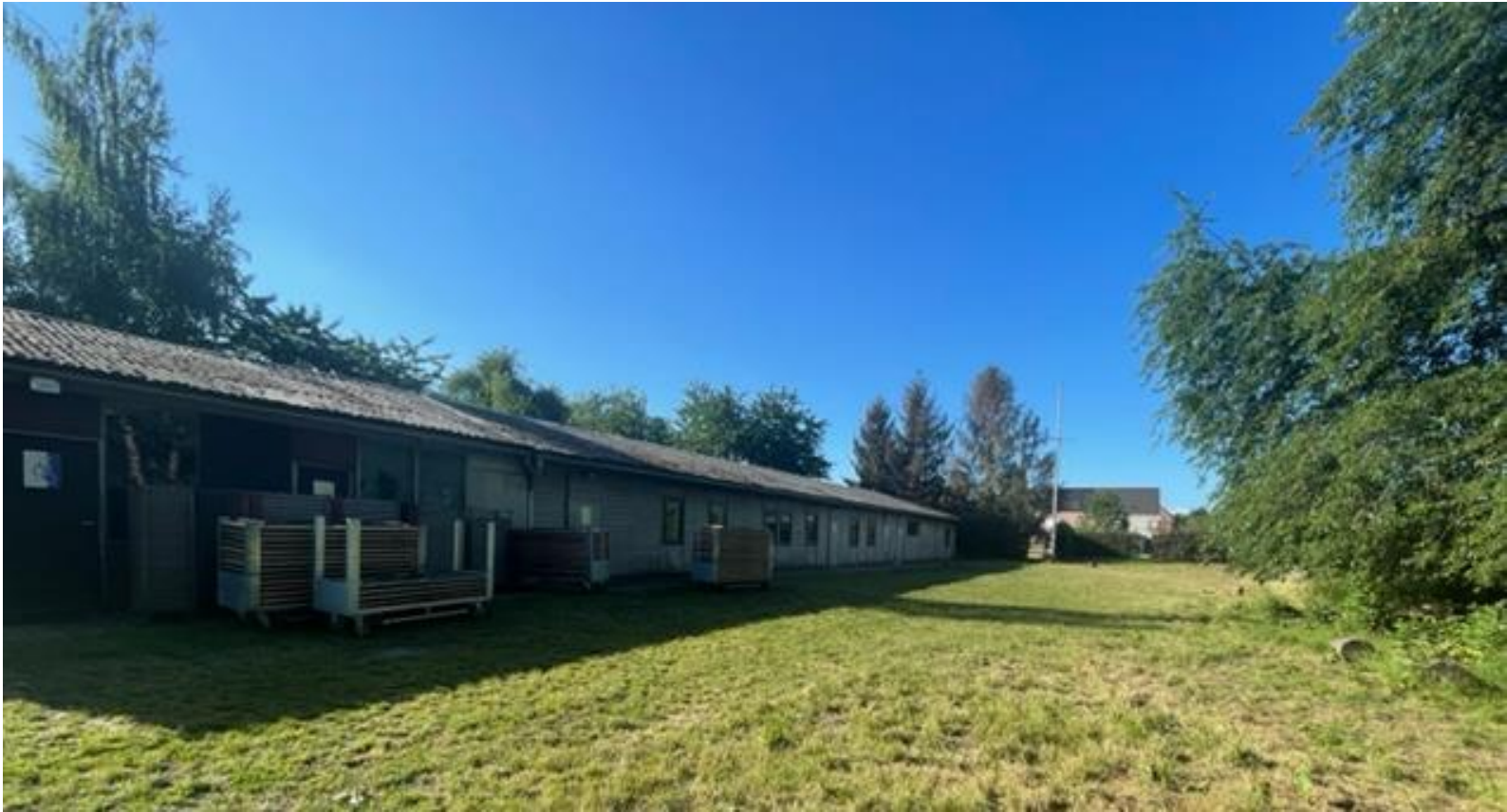
Afb. 1. Foto van het af te breken lokaal