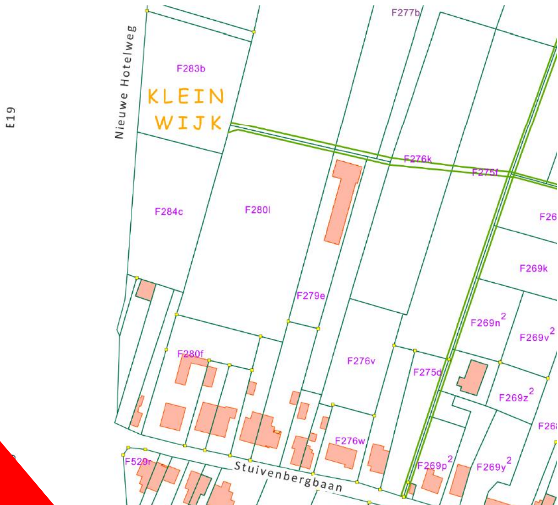
Afb. 2. Bovenaanzicht van de wijk met het nieuwe lokaal in perceel F279e

Het perceel is momenteel bebouwd met een bestaand, te slopen gebouw dat dienst doet als scoutslokaal. Hiervan is de oppervlakte 408 m 2 en het volume 1467,72 m 3 . Het nieuw te bouwen lokaal heeft een oppervlakte van 521 m 2 en een volume van 2030 m 3 . In het gebouw bevinden zich lokalen voor leiding en leden, een sanitaire ruimte met toiletten, wasbakken en douches, keuken en bergingen. De lokalen hebben allemaal een uitgang direct naar buiten op een verhard pad onder een luifel. Het gebouw heeft een plat dak en de kroonlijsthoogte bevindt zich op 4m. De luifel heeft een hoogte van 3m. Het gebouw wordt opgetrokken in een staalstructuur met wandpanelen in silexbeton. Pas na voltooiing wordt het bestaande gebouw gesloopt, zodat de scoutswerking niet onderbroken dient te worden.